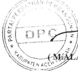
( MASLAMSYAH YAKUB )