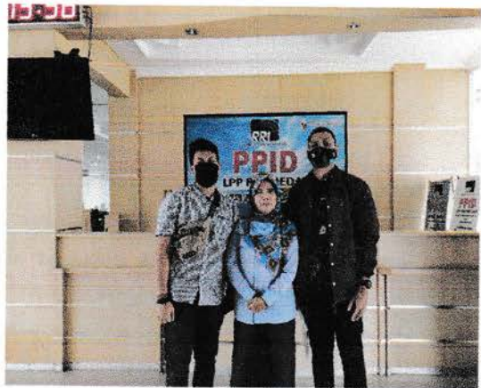
Foto bersama pembimbing lapangan RRI Medan divisi PRO 2