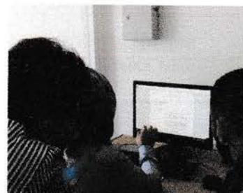
Proses produksi Voxpop, Filler, dan Iklan Layanan