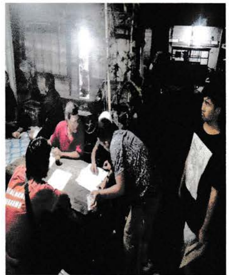
Coklit Pilkada 2020