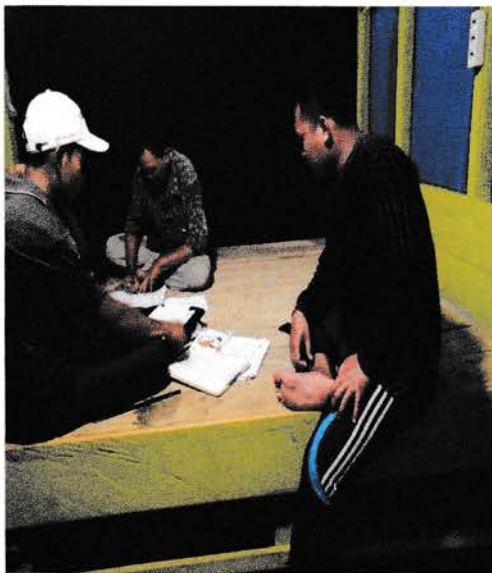
Coklit Pilkada 2020