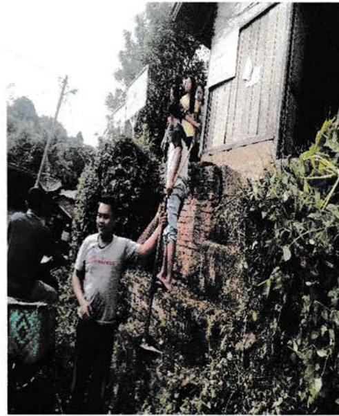
Gotong royong kebersihan kawasan Kantor Desa