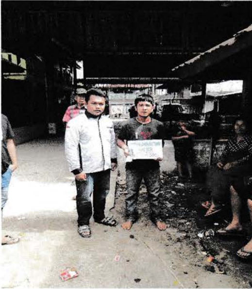
Foto Masyarakat penerimaan BLT