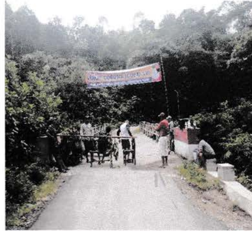
Posko covid Desa jandi