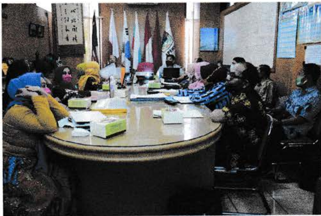
Gambar 5: Dokumentasi saat berada di Pemko Medan