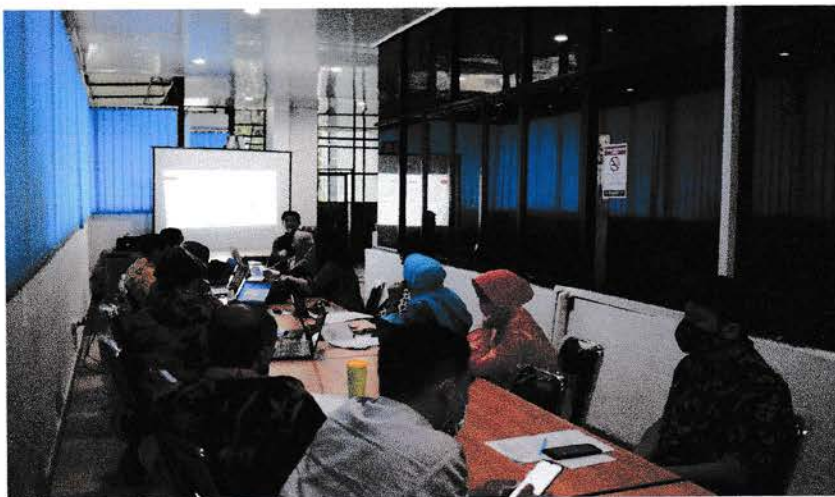
Gambar 6 : Dokumentasi saat berada di Pemko Medan