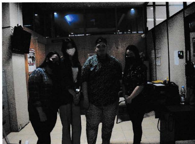
Gambar 2 : Pemulis dan rekan berfoto bersama pembimbing KKL