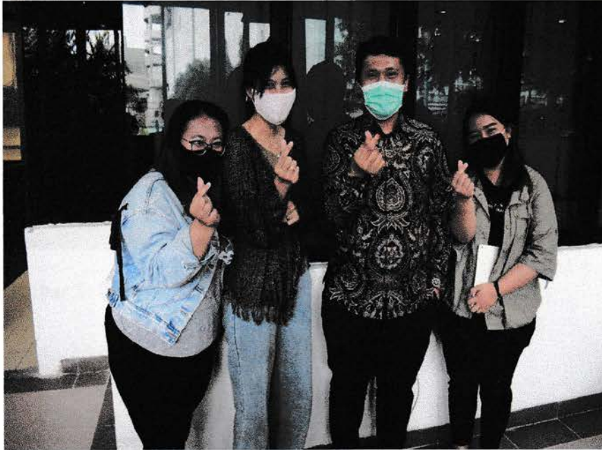
Gambar 3 : Pemulis dan rekan berfoto dengan pemateri di Seminar yang di adakan PT Harian Medan Digital