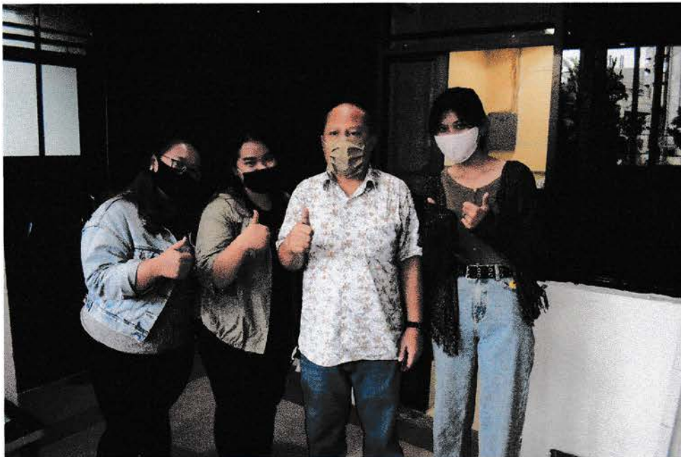
Gambar 4 : Pemulis dan rekan berfoto dengan Pemateri ke 2