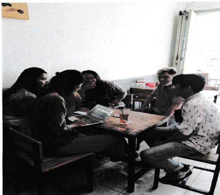
Gambar 1 : Pemulis dan peserta KKL lainnya berdiskusi dengan dosen pembimbing