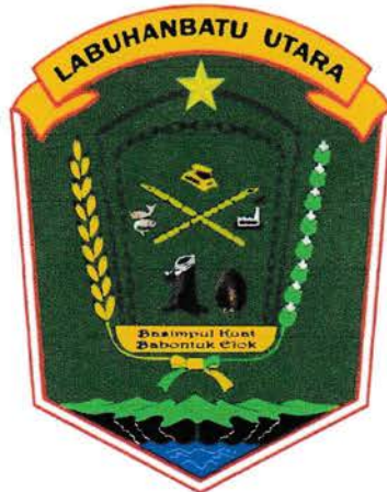
Gambar 2.2 Logo Kabupaten Labuhanbatu Utara