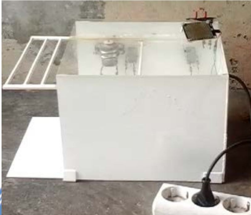
Gambar saat rel jemuran berada di luar ruangan