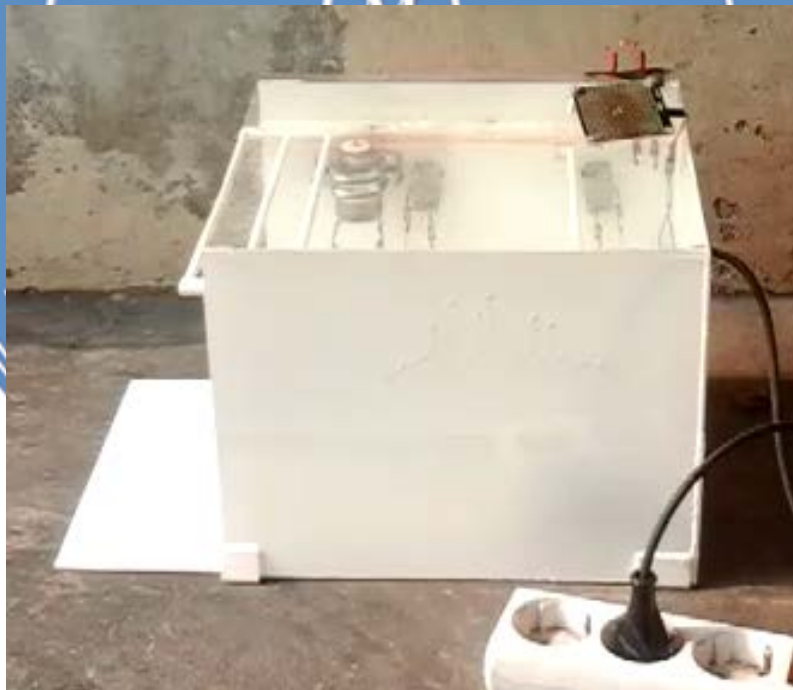
Gambar saat rel jemuran berada di dalam ruangan