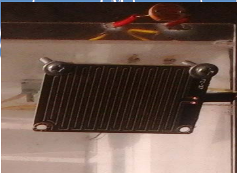
Gambar sensor cahaya dan sensor deteksi basah