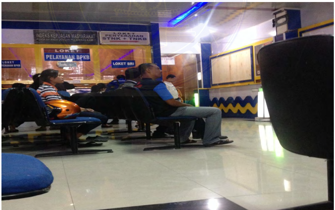
Masyarakat sedang mengantri di loket pelayanan BPKB( Buku Pemilik Kendaraann