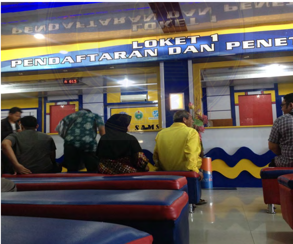
Masyarakat sedang mengantri di loket 1 Pendaftaran dan Penetapan