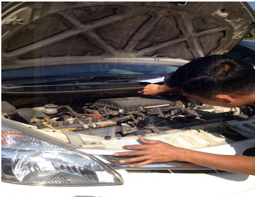
Dokumentasi tentang Cek Fisik Kendaraan Bermotor Sedang Berlangsung