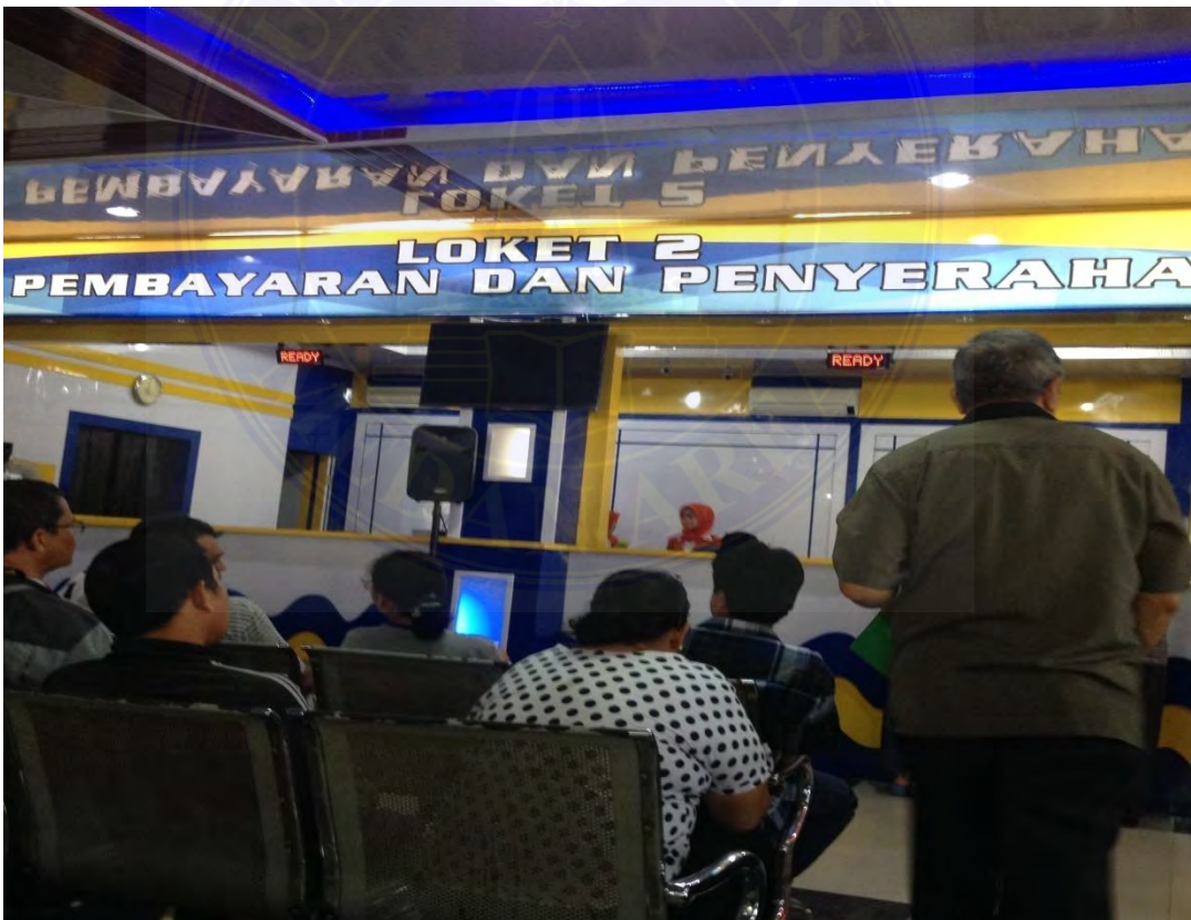
Masyarakat sedang mengantri diloket 2 Pembayaran dan Penyerahan