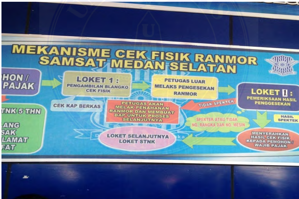
Dokumentasi tentang Mekanisme cek fisik kendaraan bermotor