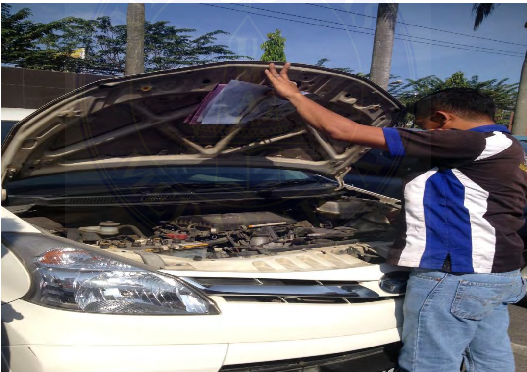
Dokumentasi tentang Cek Nomor Mesin sebagai proses cek fisik kendaraan bermotor