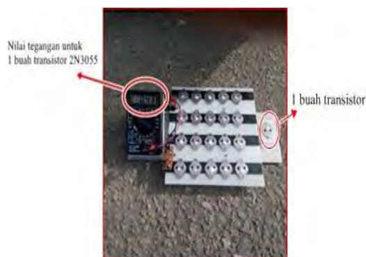
Gambar 5. Pengukuran Voltase untuk satu buah transistor 2N3055

Satu transistor jengkol seharga Rp 2.500,00 dapat menghasilkan Voltase rata-rata sebesar 0,4 - 0,6 Volt, dan berikut Gambar 4.2 pengukuran tegangan untuk satu transistor 2N3055 :