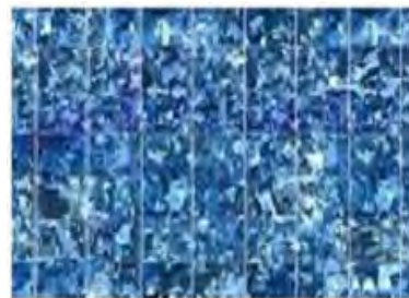
Gambar 4. Solar cell gallium arsenide

Jenis keempat adalah panel surya yang terbuat dari GaAs (Gallium Arsenide) yang lebih efisien pada temperatur tinggi.