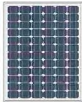
Gambar 1: Panel solar cell monokristalin

Jenis pertama, yaitu jenis yang terbaik dan yang terbanyak digunakan masyarakat saat ini, adalah jenis monokristalin. Panel ini memiliki tingkat efisiensi antara 12 sampai 14%.