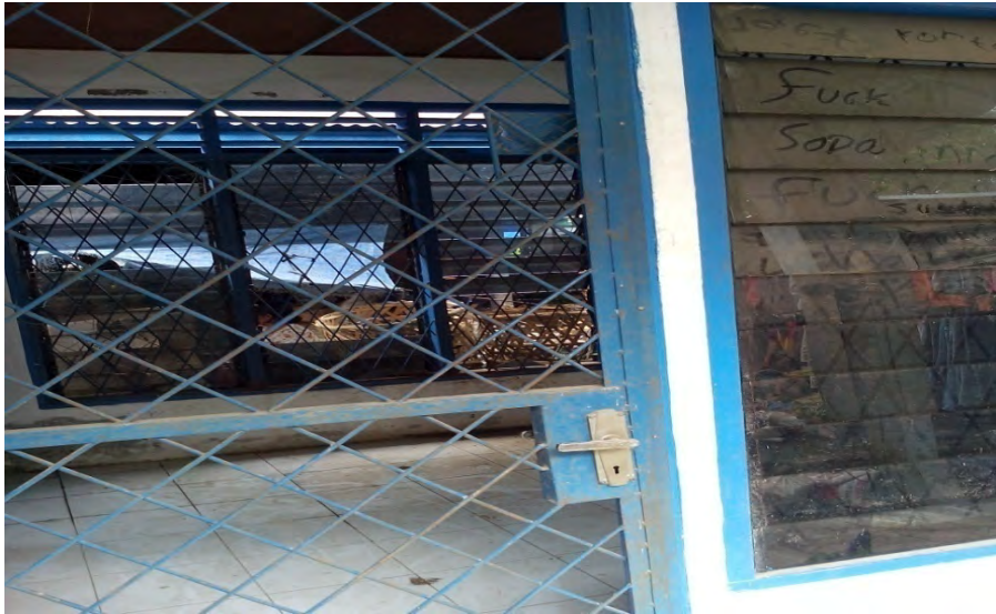
Gambar. 19 Keadaan Kantor Pasar yang kosong tidak ada peralatan kantor