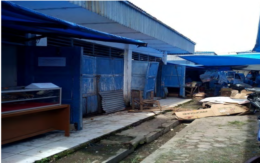
Gambar. 11 Tampak Kios yang tutup dan tidak rapi dan tidak terawat