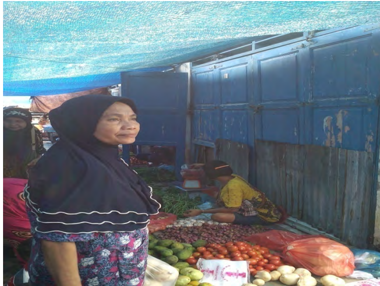
Gambar. 5 Tampak Pedagang berjualan di depan kios yang tutup dan hampir menutupi jalan sehingga mengganggu aktifitas jalan