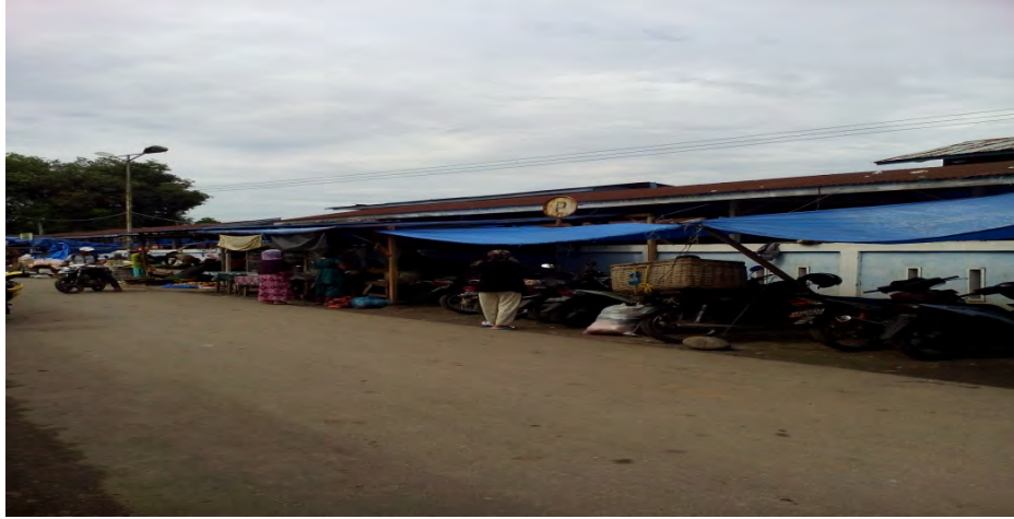
Gambar. 21 Gambar Pedagang yang berjualan di luar pagar pasar di tepi jalan yang dapat mengakibatkan kemacetan jalan