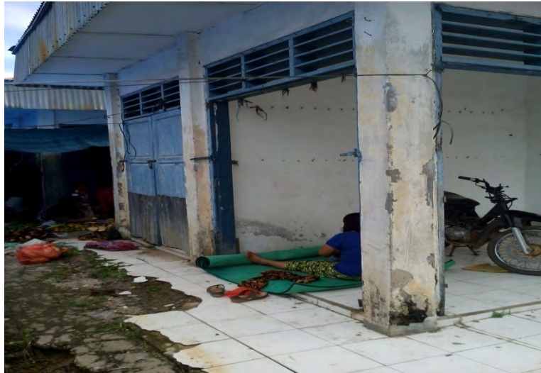
Gambar. 7 Kios yang tidak di gunakan untuk berjualan