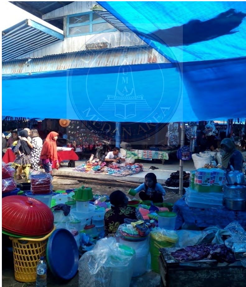
Gambar. 12 Suasana Pasar yang ramai