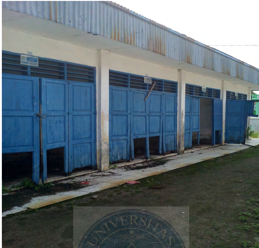
Gambar 1. Sarana Kios yang tidak ditempati