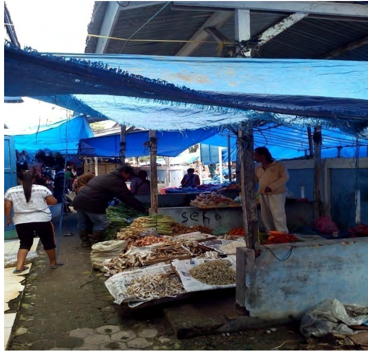
Gambar. 23 Pedagang Kios Layang