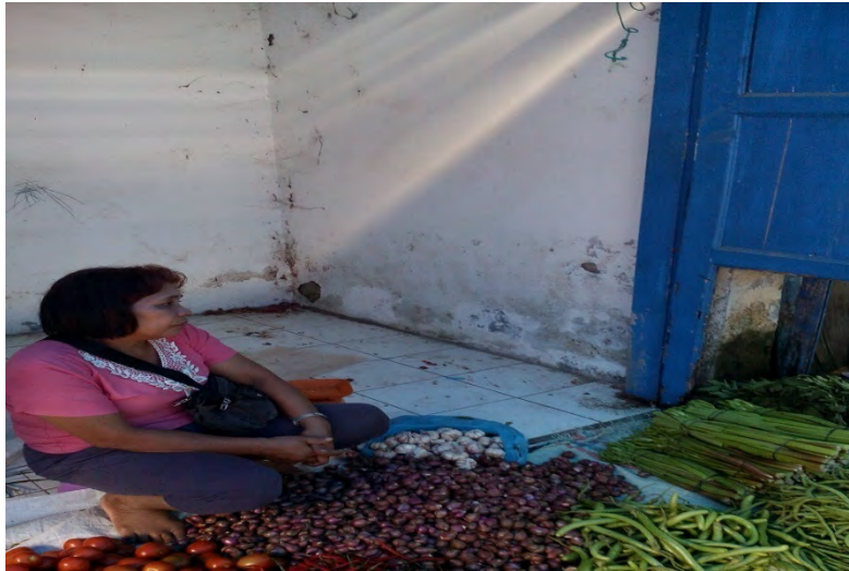
Gambar.3 Pedagang yang memilih berjualan diluar kios