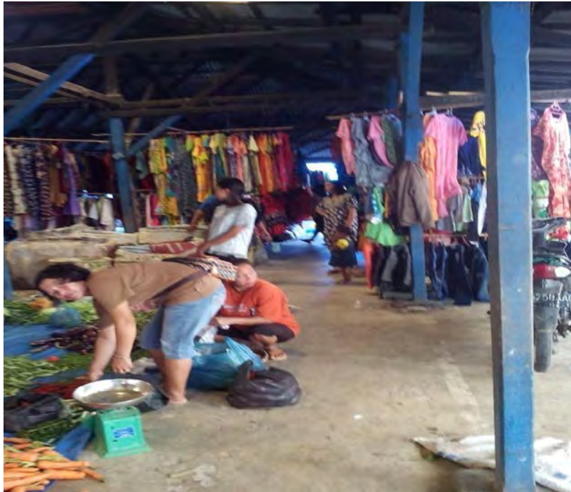
Gambar .15 Pedagang yang berjualan sayur dan Pakaian