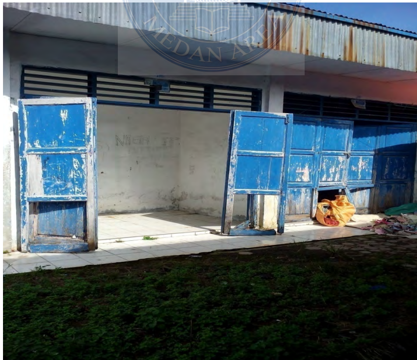
Gambar. 2 Sarana Pasar yang kosong tidak ditempati pedagang