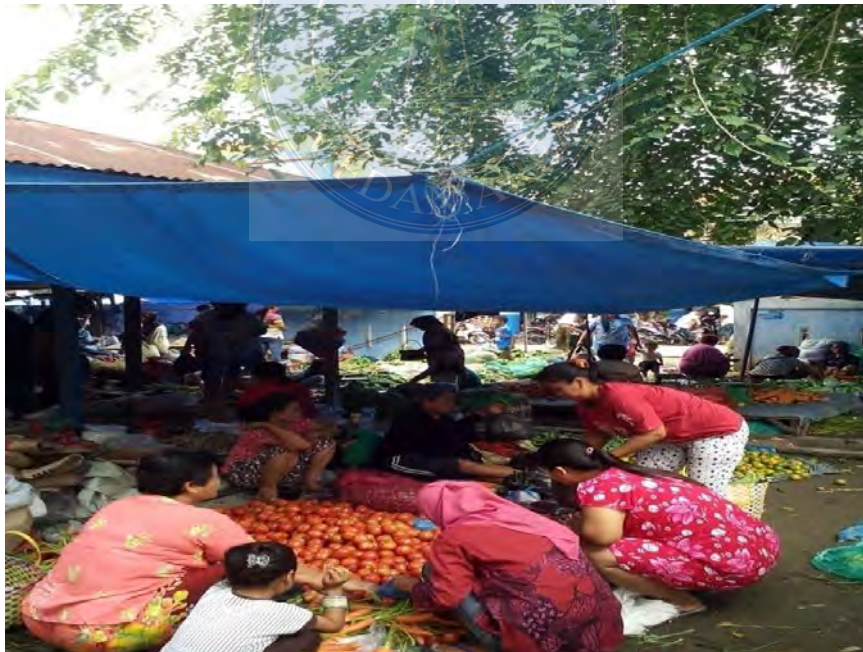
Gambar. 18 situasi Pasar yang ramai