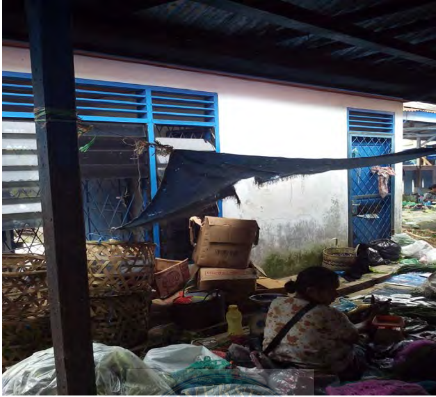
Gambar.17 Pedagang yang berjualan di belakang Kantor Pasar dan tampak kurang rapi