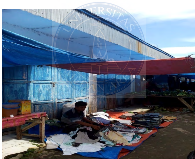
Gambar. 6 Pedagang monza yang berjualan di depan kios yang tutup