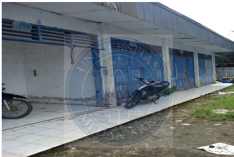
Gambar. 8 Kios yang kosong tidak digunakan untuk berdagang