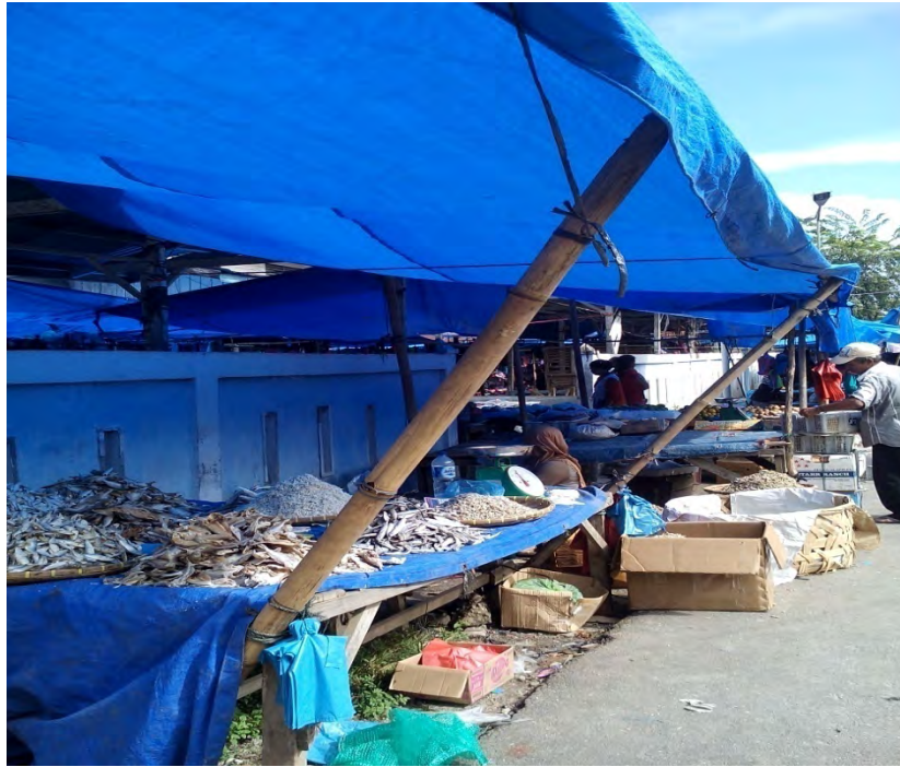
Gambar. 9 Pedagang yang berjualan di luar pagar pasar