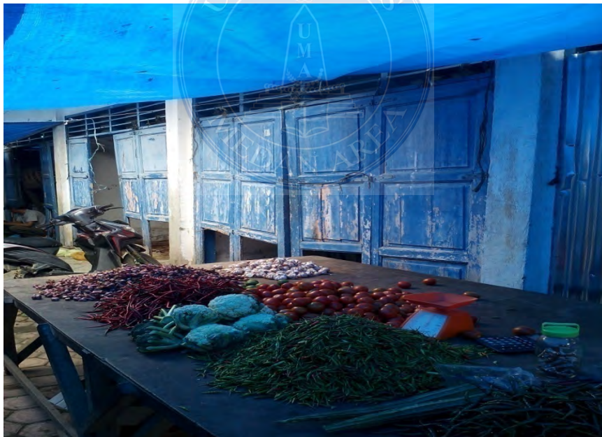
Gambar. 24 dagangan yang di jajakan di luar kios