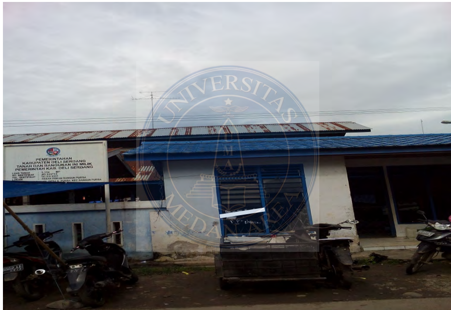
Gambar. 22 Kantor Pasar dilihat dari depan