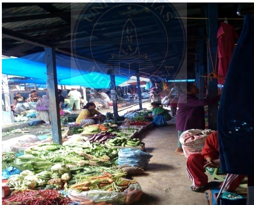
Gambar. 16 Suasana Pasar di dalam lokasi Pasar los dan Kios Layang