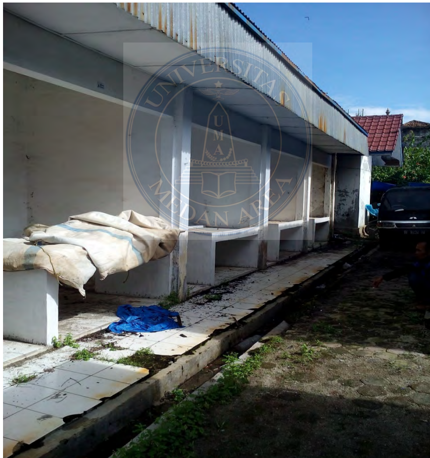
Gambar. 14 Kios yang kosong dan tampak tidak bersih