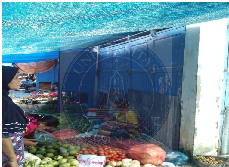
Gambar.4 Pedagang yang berjualan di kaki 5 Kios