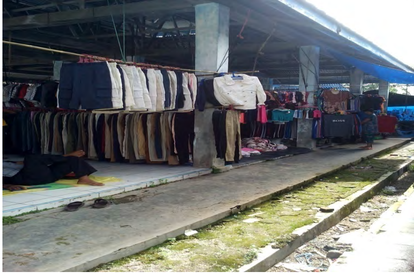
Gambar.13 Gambar Pedagang Kain