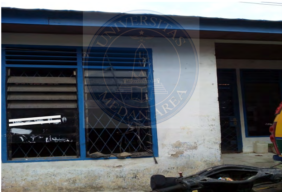
Gambar. 20 Kantor Pasar tampak tidak ada baleho, spanduk untuk informasi mengenai Surat Izin Pemakaian Tempat Usaha