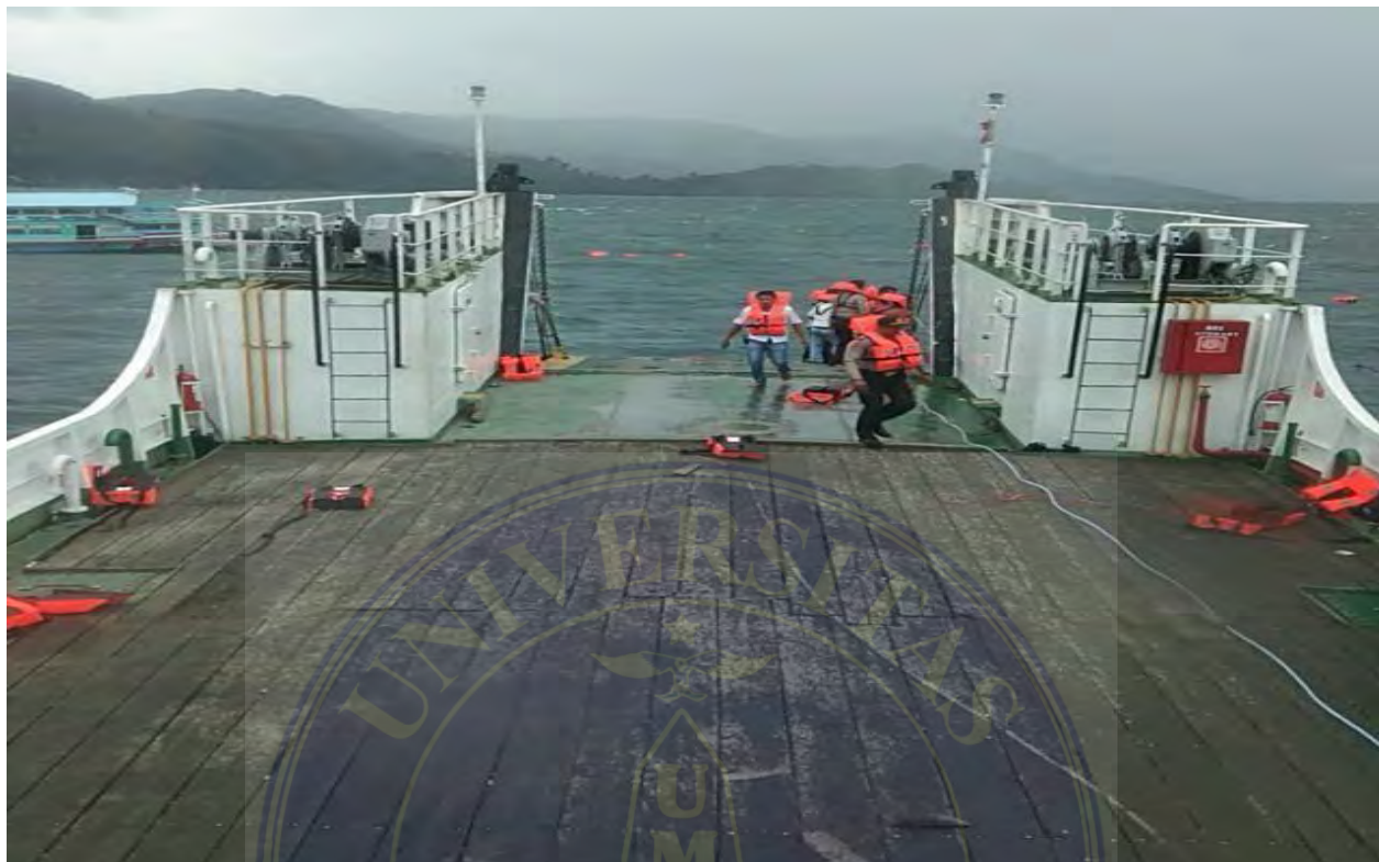
FOTO-FOTO TENTANG PENCARIAN KORBAN TENGCELAMNYA KAPAL KM. SINAR BANGUN