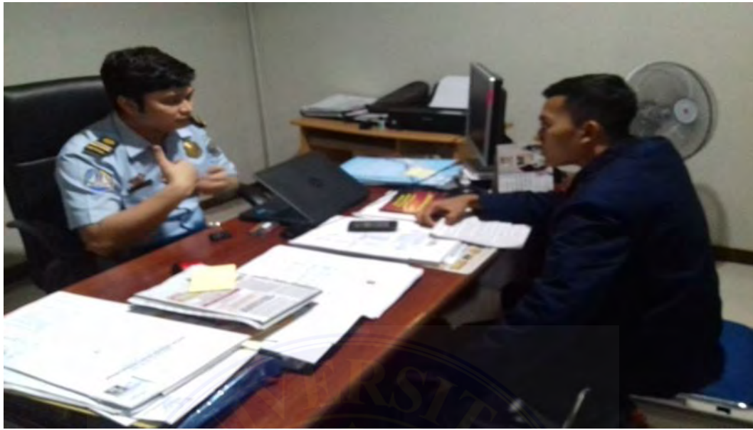
Wawancara dengan Kepala Seksi Pengawasan Orang Asing