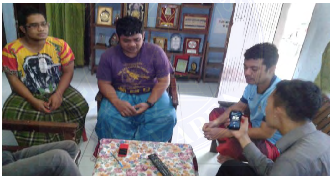
Wawancara dengan Warga Negara Asing Asal Thailand