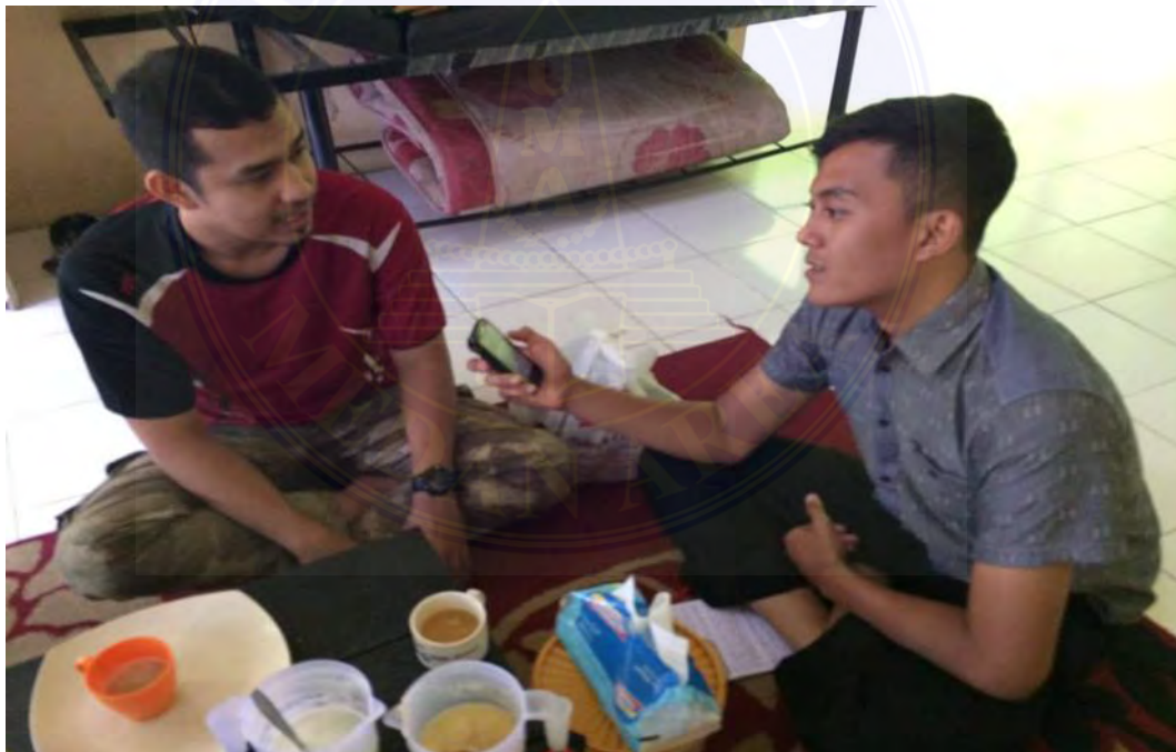
Wawancara dengan Warga Negara Asal Malaysia