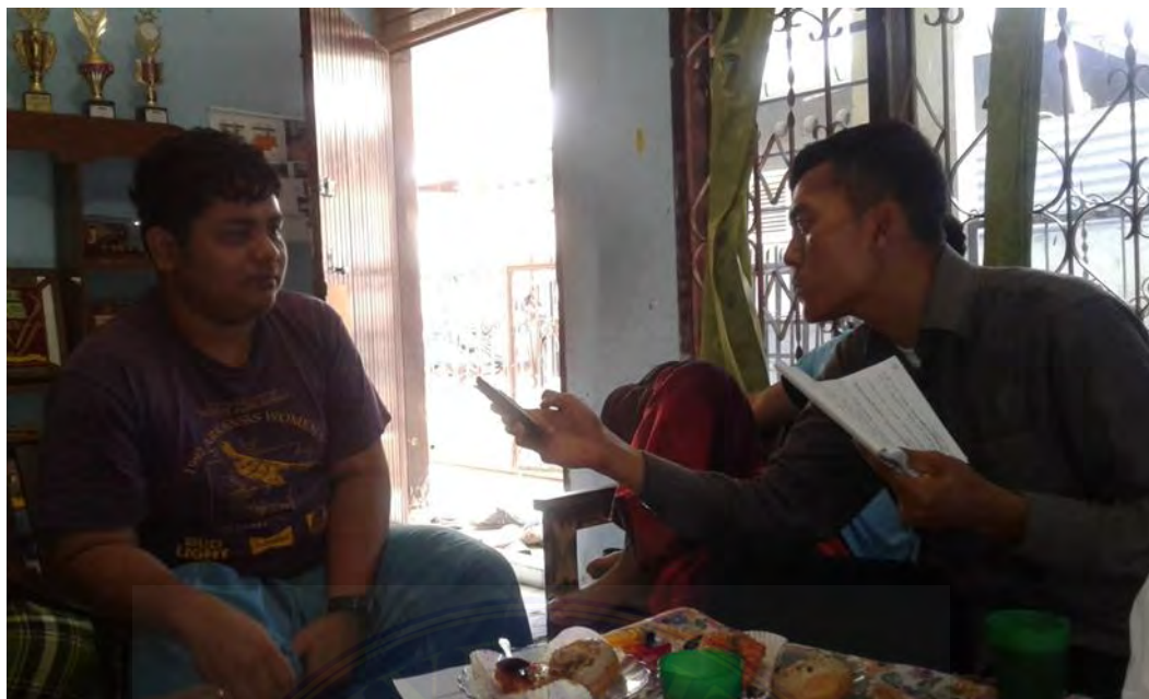
Wawancara dengan Warga Negara Asing Asal Thailand