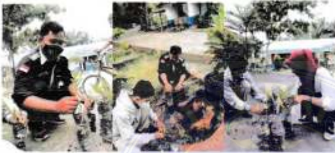
Tanggal 22 Oktober 2021