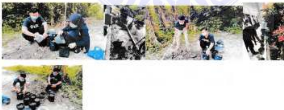
Tanggal 04 September 2021