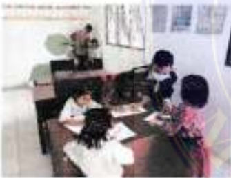
Tanggal 23 Oktober 2021