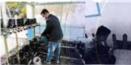
Tanggal 06 Oktober 2021