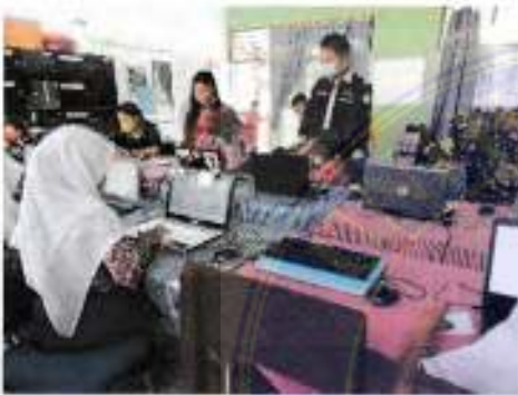
Tanggal 17 November 2021