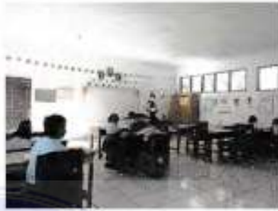
Tanggal 09 November 2021