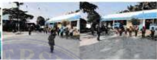
Tanggal 09 Desember 2021