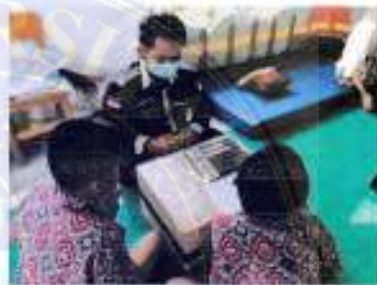
Tanggal 18 November 2021