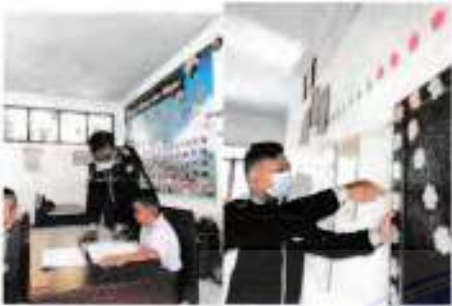
Tanggal 04 Oktober 2021