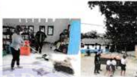
Tanggal 05 Oktober 2021