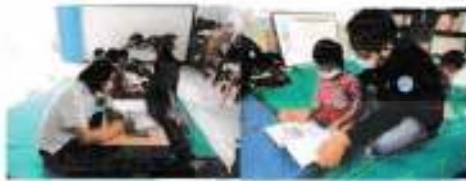
Tanggal 08 Desember 2021