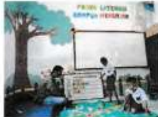
Tanggal 16 November 2021