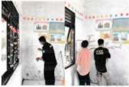
Tanggal 21 Oktober 2021