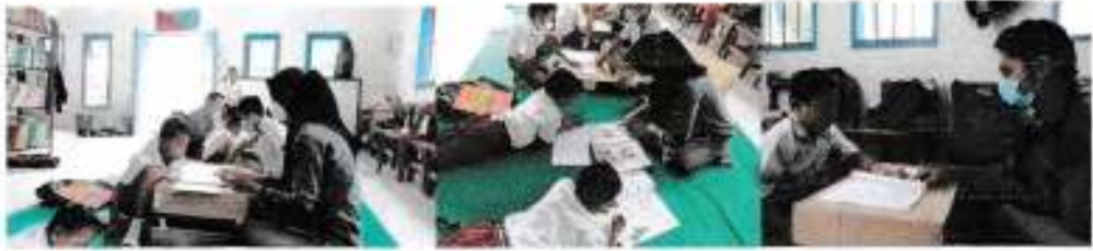
Tanggal 08 Desember 2021