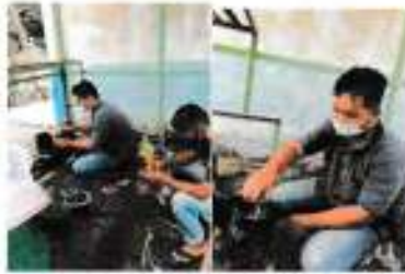
Tanggal 01 September 2021