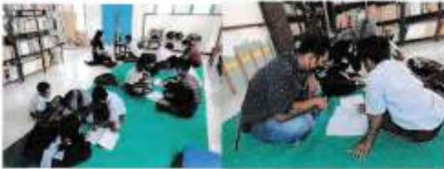
Tanggal 15 November 2021