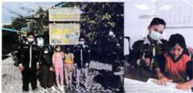
Tanggal 03 September 2021