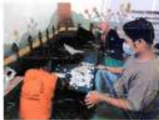
Tanggal 10 Desember 2021