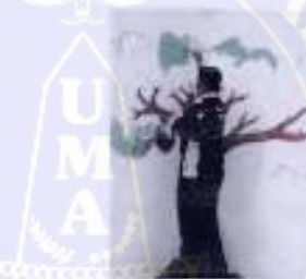
Tanggal 08 Oktober 2021