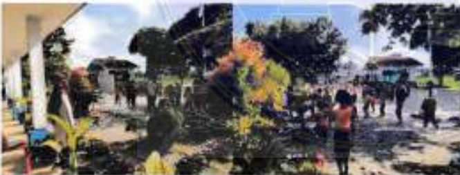
Tanggal 20 November 2021