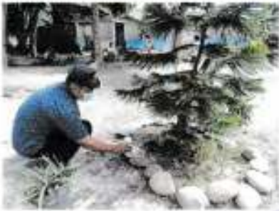
Tanggal 08 November 2021