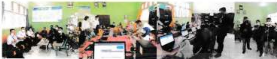
Tanggal 02 September 2021