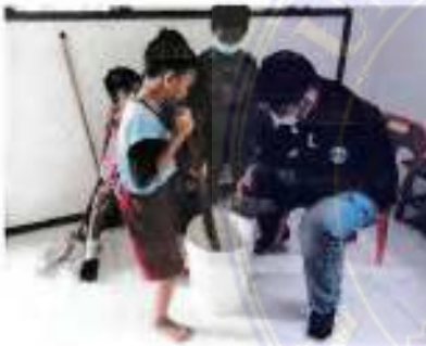
Tanggal 10 November 2021