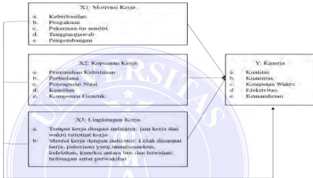
Gambar 1. Kerangka Pemikiran

sehingga waktu kerja dapat dimanfaatkan dengan baik dan diharapkan prestasinya juga lebih tinggi. Tempat kerja menggabungkan koneksi kerja yang dibingkai antara perwakilan individu dan koneksi kerja di antara bawahan dan bos seperti tempat kerja sebenarnya di mana perwakilan berada.