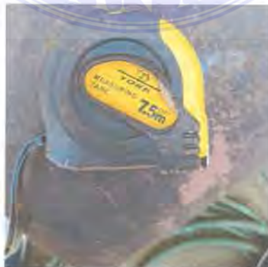
Gambar 3 9. Measuring Tape

Fungsi Measuring Tape atau yang sering disebut dengan meteran adalah untuk mengukur bahan baku yang akan ditandai, hal ini dilakukan untuk memudahkan pekerja dalam memotong bahan baku sesuai dengan ukuran yang telah ditetapkan.