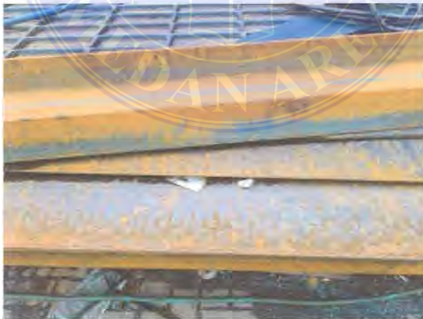
Gambar 3 1. Bahan Baku

Bahan baku yang akan digunakan pada pembuatan produk chasis lori kapasitas 4,5 ton ini adalah besi UNP 200x80.