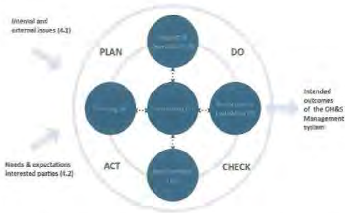
Gambar 4. 1. Hubungan PDCA dengan kerangka ISO 45001:2018