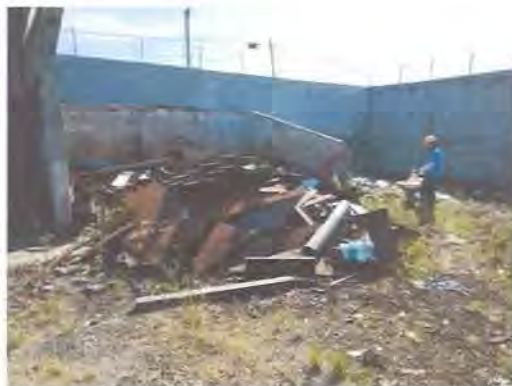
Gambar 3 11. Tempat Pembuangan Limbah Plat Besi

Limbah yang dihasilkan dari proses produksi pembuatan komponen – komponen adalah berupa potongan plat – plat besi itu kemudian dijual atau diambil oleh penyortir yang sudah bekerja sama dengan PT. Pancakarsa Bangun Reksa. Berikut merupakan tempat penumpukan limbah plat besi dan limbah B3 dapat dilihat pada gambar :