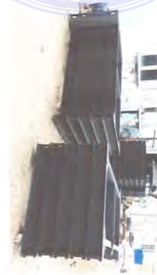
Gambar 3 7. Produk yang telah dilakukan Pengecatan

Berikut adalah gambar produk yang telah dilakukan pengecatan.