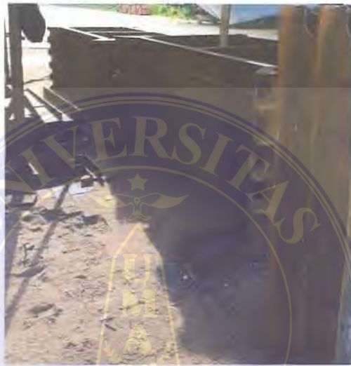
Gambar 3 6. Finishing

Langkah selanjutnya adalah finishing, pada tahap ini akan dilakukan pengamplasan sisa kerak pengelasan. Dan dokumentasi penelitian hanya sampai pada tahap finishing , dimana setelah tahapan ini akan dilakukan pengecatan, setelah itu dilakukan perakitan dengan memasang AS dan roda. Setelah produk dirakit maka produk akan dikemas dan siap dikirim.