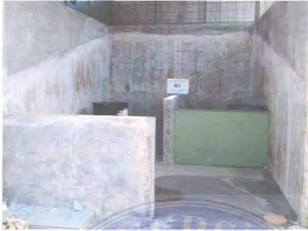
Gambar 3 12. Tempat Pembuangan Limbah B3

Selain tempat pembuangan limbah besi, PT. ini juga menyediakan tempat pembuangan limbah B3.