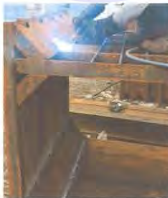
Gambar 3 5. Pengelasan

Pengelasan adalah kegiatan dimana pekerja menyatukan bagian – bagian potongan yang telah dilakukan ditahap sebelumnya. Pada tahap ini, perlahan bentuk produk sudah mulai tampak terbentuk, dimana potongan – potongan yang terkecil hingga yang besar sudah mulai disatukan.