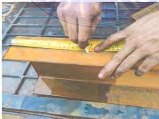
Gambar 3 3. Penggarisan Bahan Baku

Setelah melakukan pengukuran terhadap bahan-bahan yang akan dipotong, langkah selanjutnya adalah melakukan penggarisan yang bertujuan untuk menandai seberapa panjang, lebar, dan kemiringan yang akan dipotong. Biasanya para pekerja akan menggunakan kapur besi atau biasanya disebut stone pencil .