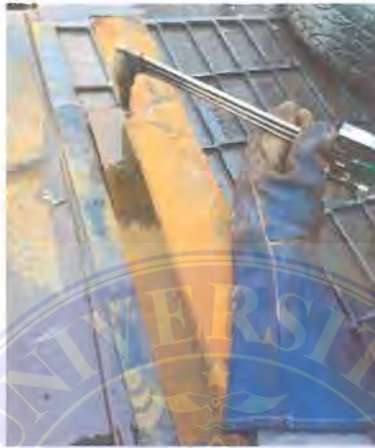
Gambar 3 4. Pemotongan Menggunakan Blander

memotong menggunakan alat blander potong oksigen, hal ini dilakukan karena bahan yang digunakan sangat tebal sehingga tidak memungkinkan pekerja memotong dengan menggunakan gerinda potong atau biasa disebut angel grinder .