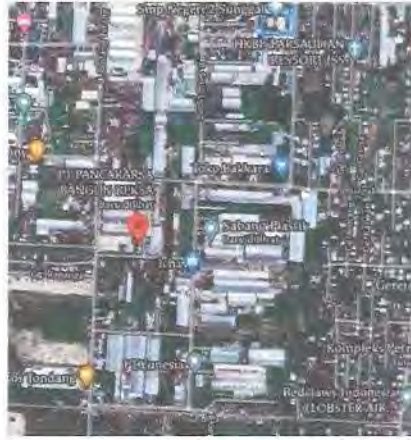
Gambar 2 1. Denah Lokasi