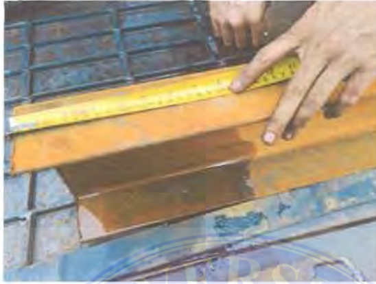
Gambar 3 2. Pengukuran

dituntut untuk mengerti membaca gambar teknik agar tidak melakukan kesalahan dalam mengukur bahan yang akan diproduksi nantinya.