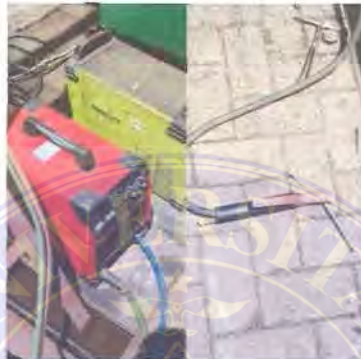
Gambar 3 8. Alat Las

Pada proses pembuatan chasis lori alat las digunakan sebagai penyambung dua komponen atau menyatukan bagian – bagian dari potongan.