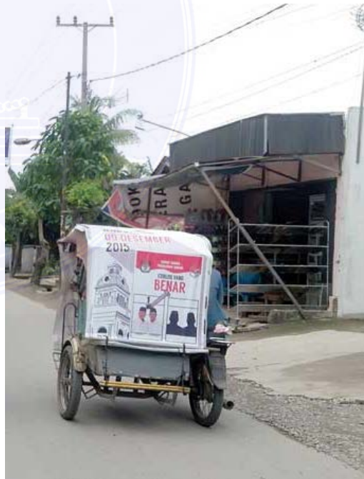
Kampanye Melalui Baliho dan Spanduk