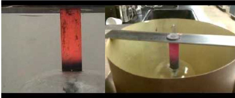
Gambar 3.4 : Proses Jominy Test ( Quenching )

C. Melakukan pendinginan dengan menggunakan alat uji Jominy Test samapai suhu pada benda uji turun (sesuai dengan temperature kamar).