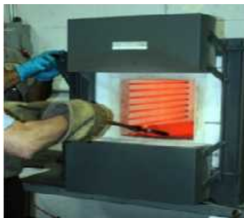
Gambar 3.3 : Perlakuan panas dengan menggunakan Oven Furnace

B. Melakukan perlakuan panas dengan cara memanaskan dengan menggunakan Oven Furnace ,serta mengatur temperatur yang di ingin kan.Setelah dipanaskan pada temepratur 700°C, 800°C,dan 900°C kemudian dilanjutkan dengan mendinginkan benda uji tersebut.