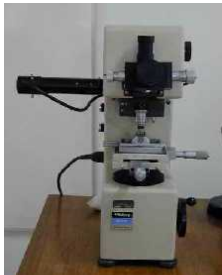
Gambar 3.5 : Alat Uji Kekerasan RockWell dengan nilai kekeran HRC

D. Setelah dilakukan kemudian dilakukan pengujian kekerasan dengan menggunakan alat uji kekerasan RockWell dengan nilai kekeran HRC.