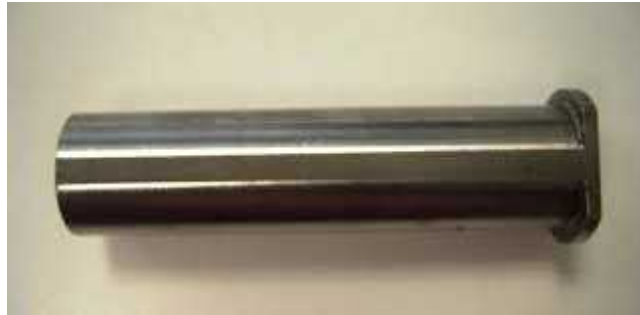
Gambar 3.2 : Benda Uji Baja ST 60

A. Mempersiapkan benda yang akan di uji yaitu baja st 60 dengan dimensi \varnothing 25.4\text{mm} x 100mm.