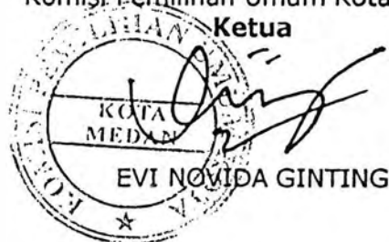
EVI NOVIDA GINTING