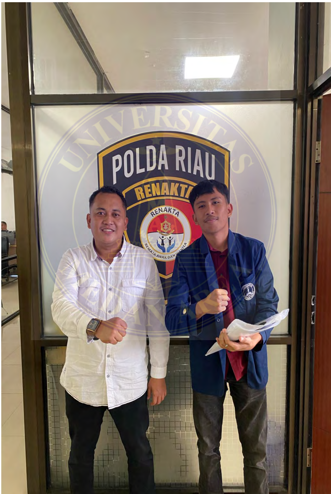
foto selesai wawancara dengan narasumber.