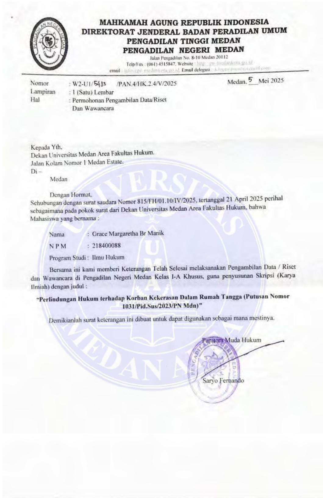
Gambar 2: Surat Keterangan Telah Selesai Melaksanakan Pengambilan Data/Riset dan Wawancara di Pengadilan Negeri Medan