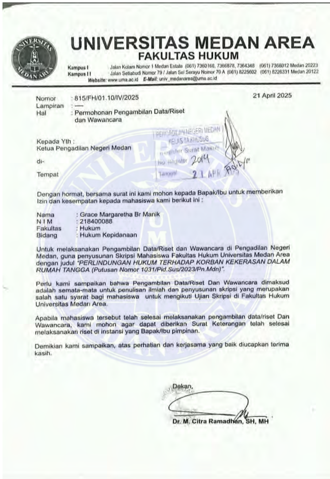
Gambar 1: surat Permohonan Pengambilan Data/Riset dan Wawancara di Pengadilan Negeri Medan