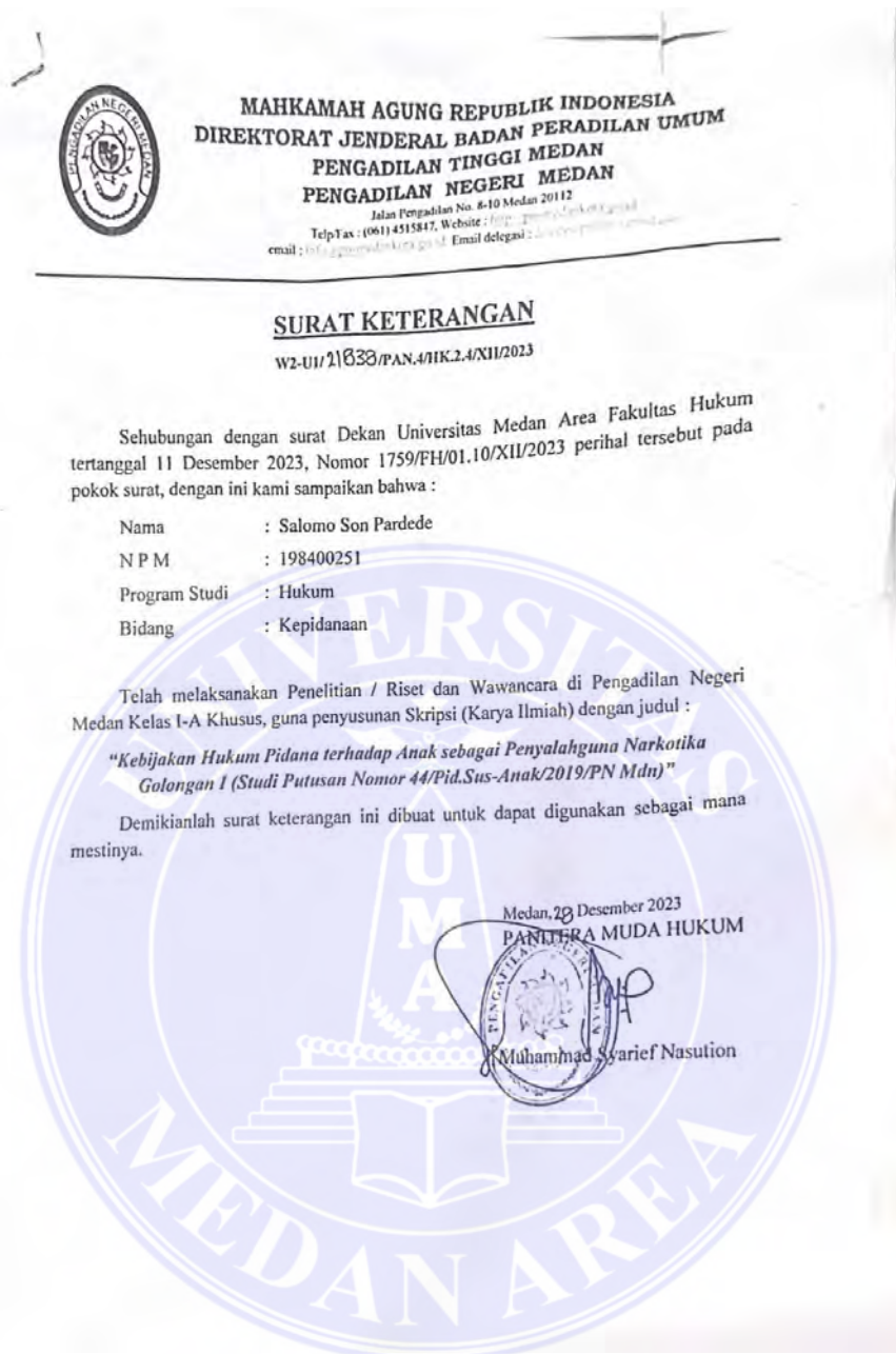
Lampiran 2 : Surat keterangan telah selesai melaksanakan penelitian/riset dan wawancara di Pengadilan Negeri Medan.