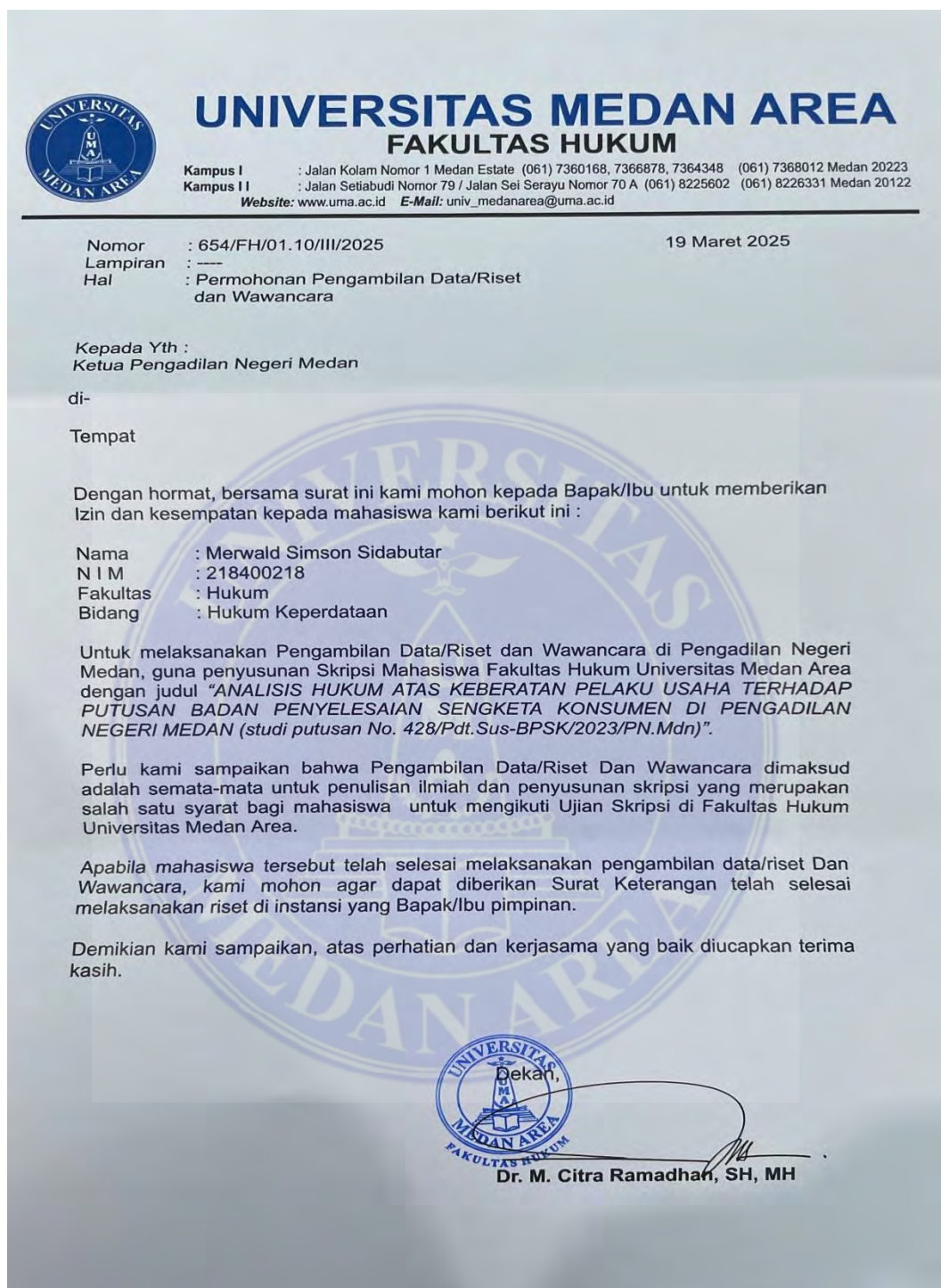
Gambar 2 Surat Pengantar Pelaksanaan Riset/Penelitian.