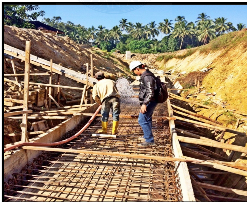
Pengerjaan saluran sekunder untuk pengaliran air irigasi