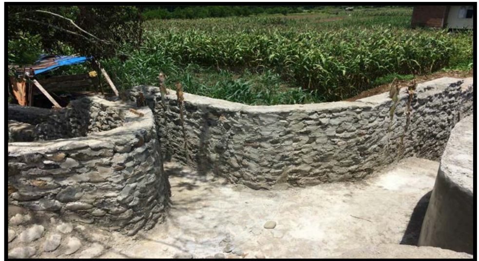
Bangunan saluran bagi sadap