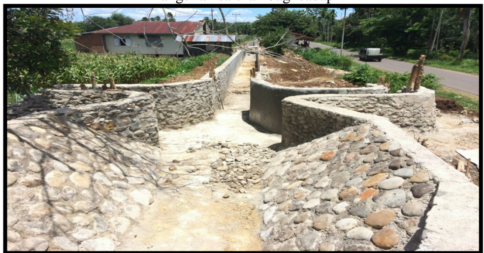
Saluran aair menuju ke persawahan warga