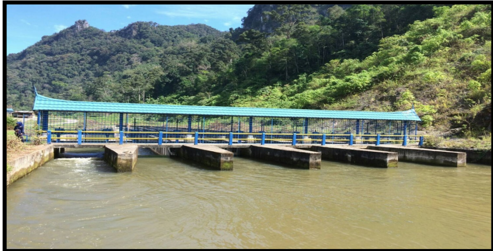
Bangunan pengendapan (kantong lumpur)