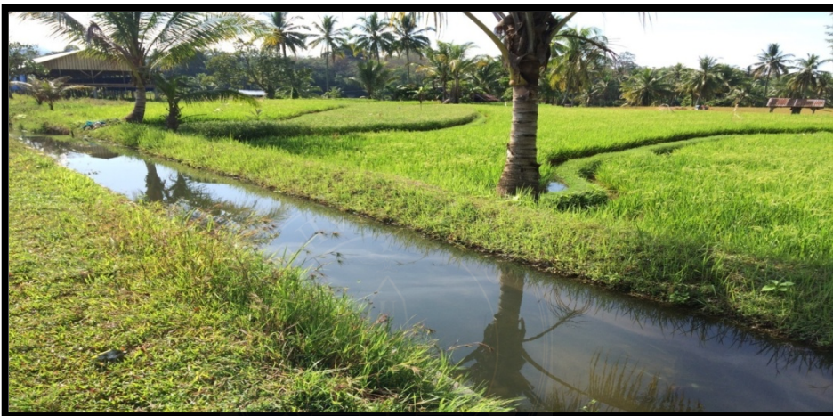
Saluran irigasi pada daerah irigasi batang sinamar