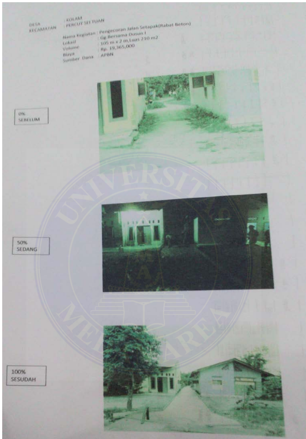
Gambar : Pengecoran Jalan Setapak Dusun I Desa Kolam