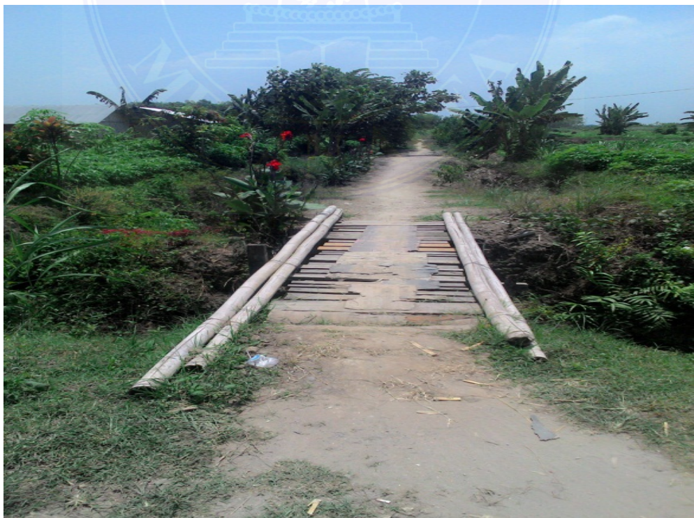
Gambar : Jembatan Desa di Dusun I Desa Kolam, 24 Februari 2016