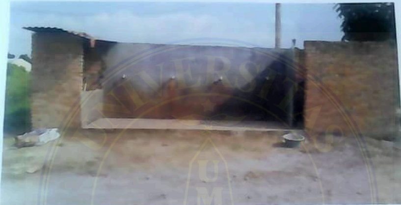
Gbr 2: Tempat wudhu dan WC Musholla tampak dari depan