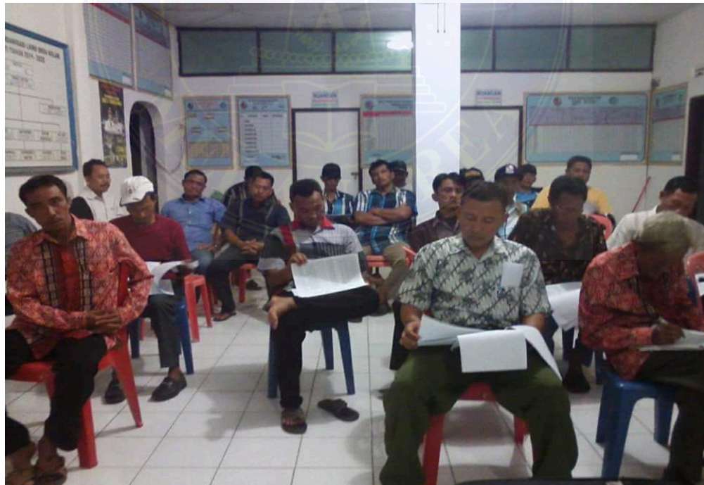
Gambar : Rapat Rencana Kerja Pembangunan (RKP) tahun 2016 yang dihadiri oleh Kepala/Ketua Dusun dan masyarakat Desa Kolam, 14 Februari 2016