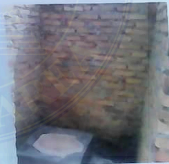
Gbr 2: WC Musholla

Gambar : Pengerjaan tempat Wudhu dan Kamar Mandi Musholla Desa Kolam 18 Maret 2016