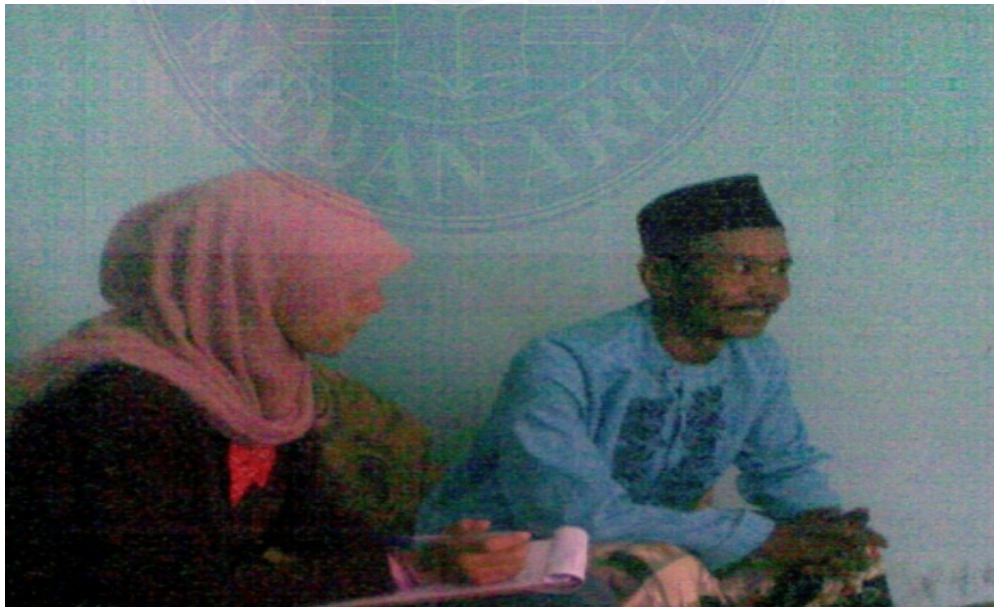
Gambar : wawancara dengan Kepala/Ketua Dusun, 03 Maret 2016