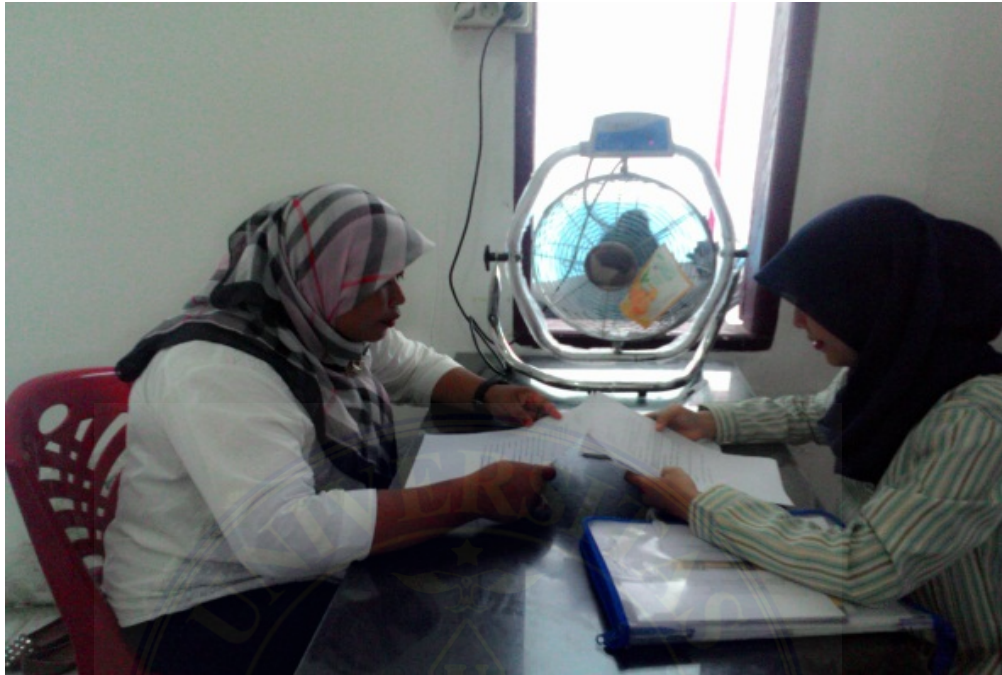
Gambar : wawancara dengan Sekretaris Desa Kolan, 02 Maret 2016