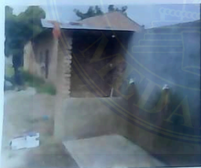
Gbr 1: Tempat Wudhu dari samping