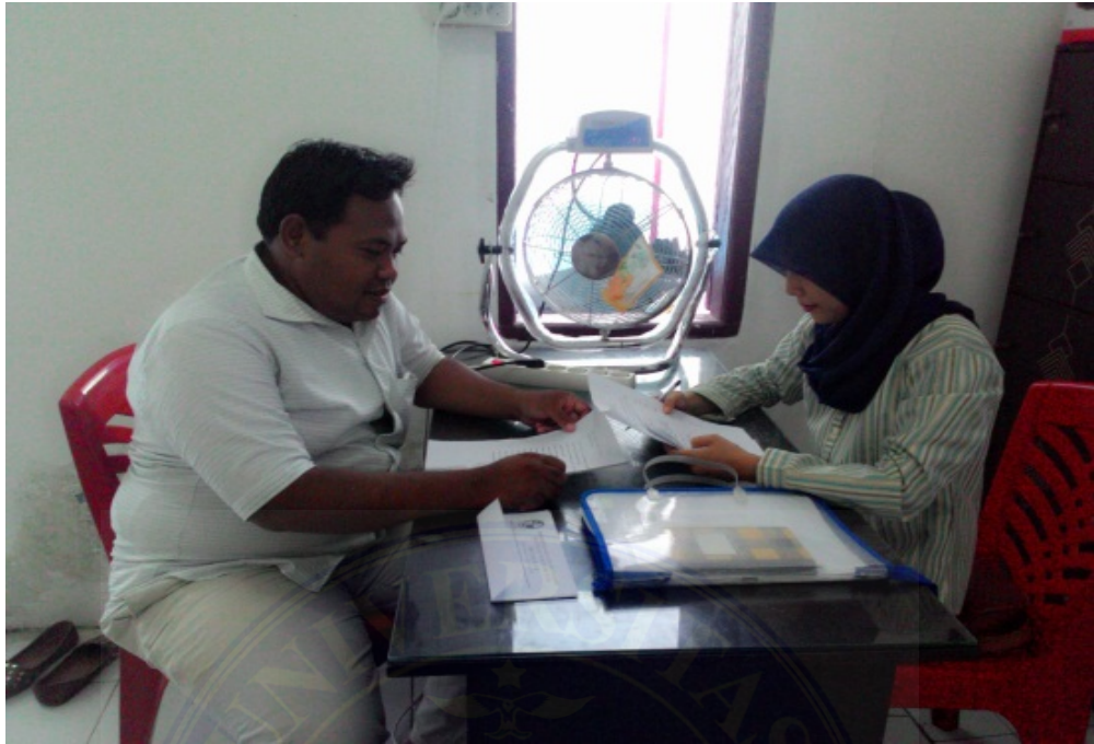
Gambar : wawancara dengan Ketua LKMD Desa Kolam, 02 Maret 2016