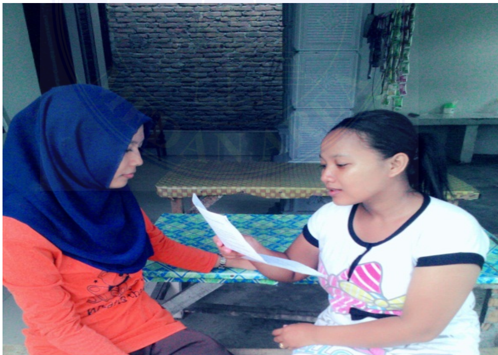
Gambar : wawancara dengan Masyarakat Desa Kolam, 25 Februari 2016