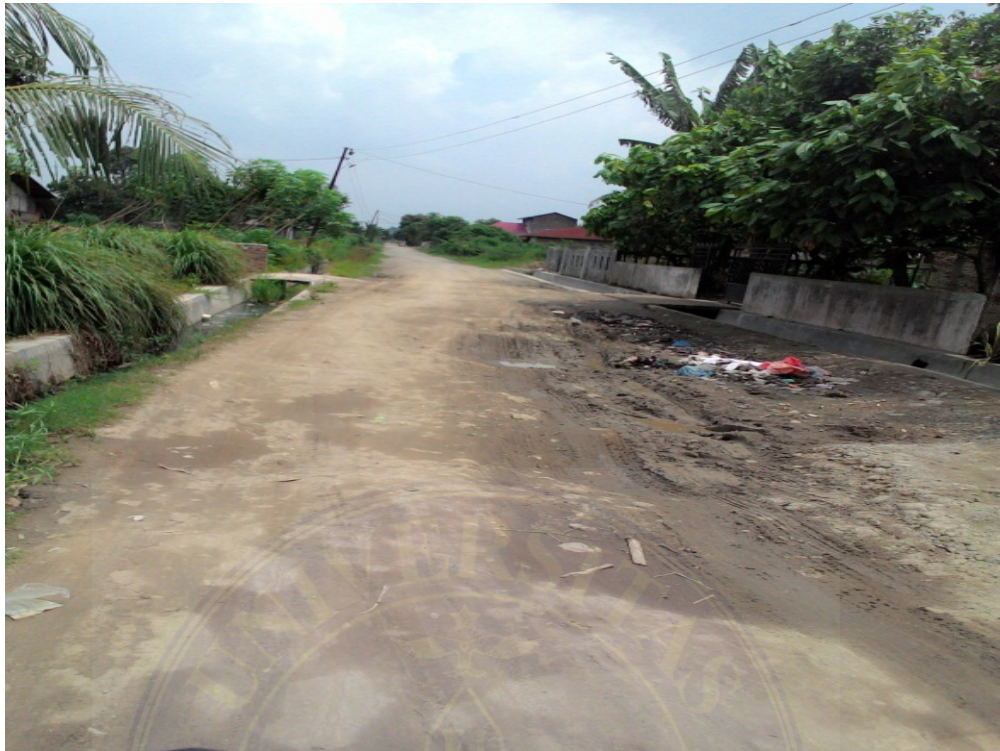
Gambar : Kondisi jalan desa Dusun I Desa Kolam, 18 Februari 2016