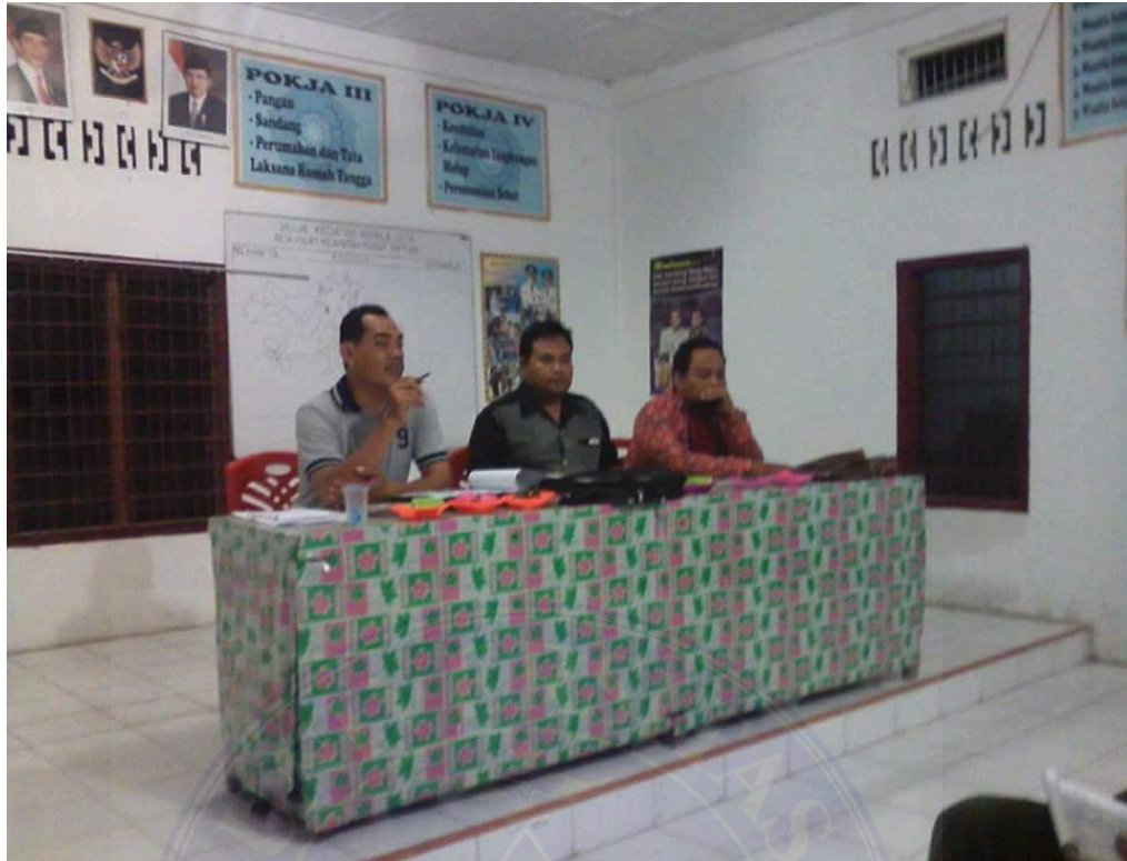
Gambar : Rapat Rencana Kerja Pembangunan (RKP) tahun 2016 Desa Kolam, 14 Februari 2016