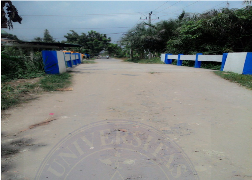
Gambar : Jembatan desa dalam keadaan baik di Jalan Utama II Desa Kolam, 03 Februari 2016