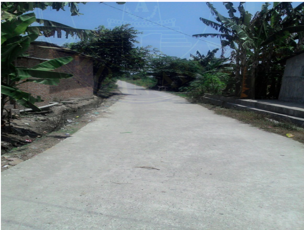
Gambar : Kondisi Jalan desa yang sudah di lakukan perbaikan di Desa Kolam, 24 Februari 2016