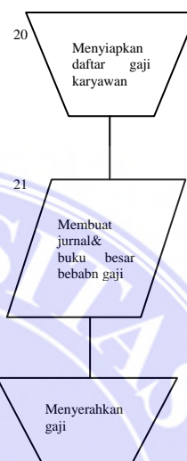
Gambar IV.2. Flow chart Prosedur Pengendalian Intern pada CV. Vecto Kreasi Mandiri