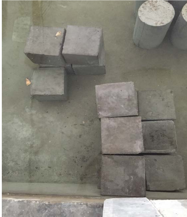
Gambar 3.1 Perendaman Benda Uji di Bak