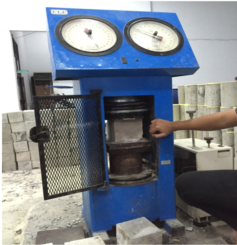
Gambar 3.2 Pengujian Kuat Tekan Beton dengan Compress Test Machine