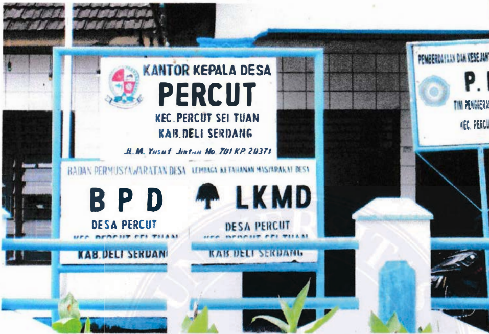
Gambar.1 Lokasi Penelitian