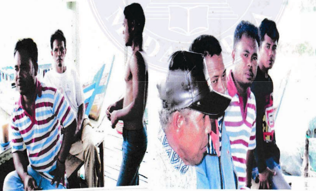
Gambar.2 Kelompok Nelayan